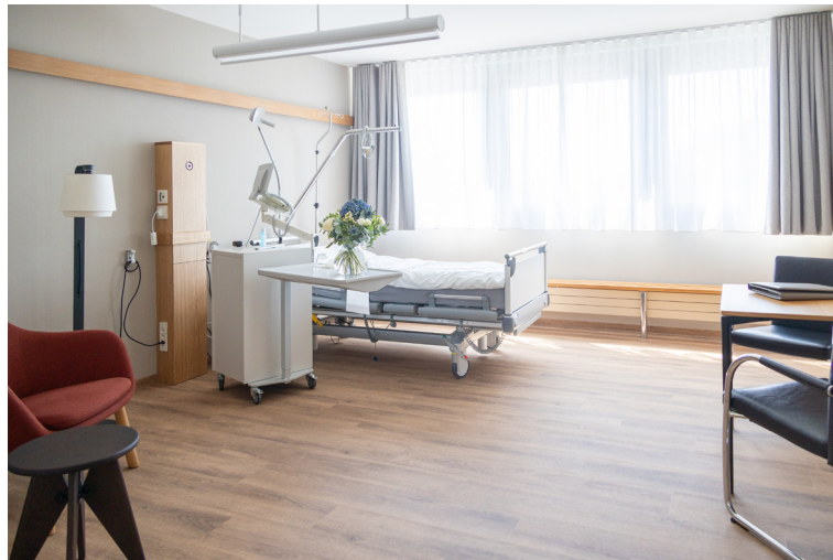
Patientenzimmer mit Privé-Möblierung