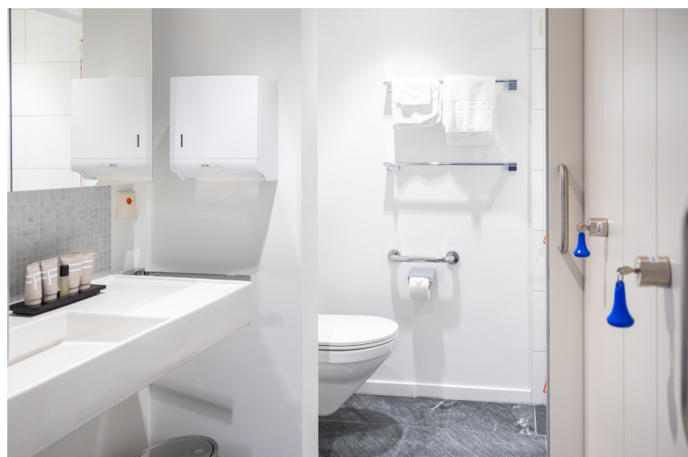
Badezimmer mit separatem WC/Duschabteil